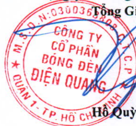
Hồ Quỳnh Hưng