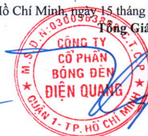
Hồ Quỳnh Hưng